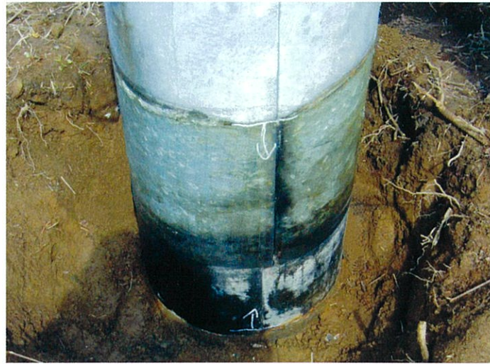
調査 平成19年(施工 23年経過)