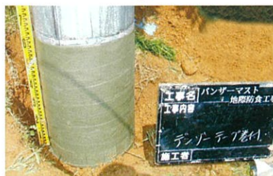
デンゾーペースト巻付